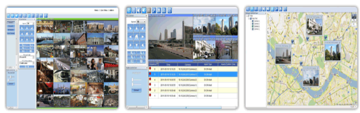
Smart NVR SW Smart Alarm SW Smart Map SW