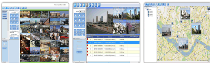
Smart NVR SW